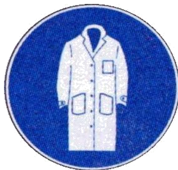
Port de la blouse obligatoire